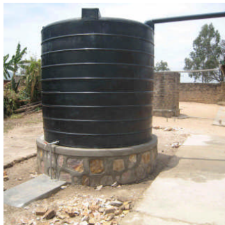
Zisterne (12) und Händewaschwasser (13)