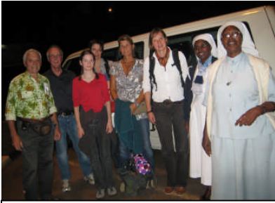
Empfang der Besucher am Flughafen (1)