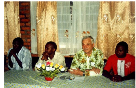
Fest der Elektriker und Elektroniker (14)