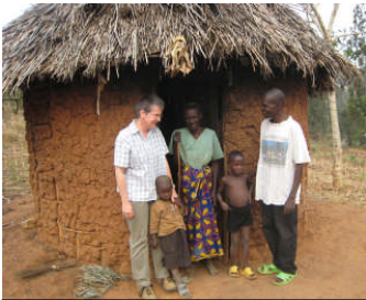
Eine alte Dame wohnt allein in dieser Hütte (4)