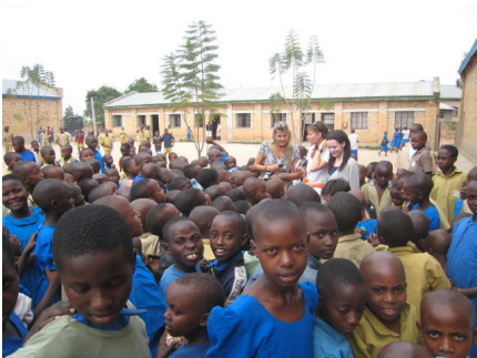
Grundschule Nyanza B (11)